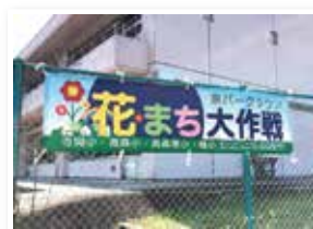
学校に掲出中の横断幕