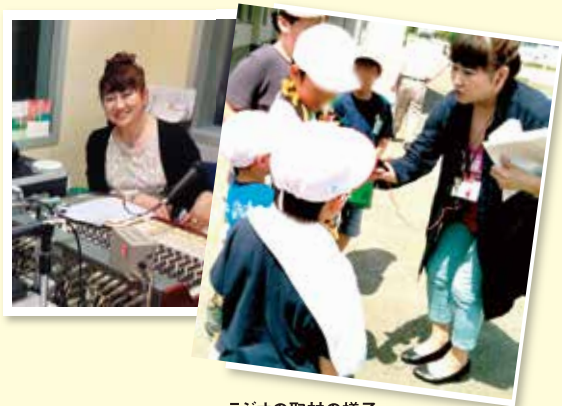
ラジオの取材の様子